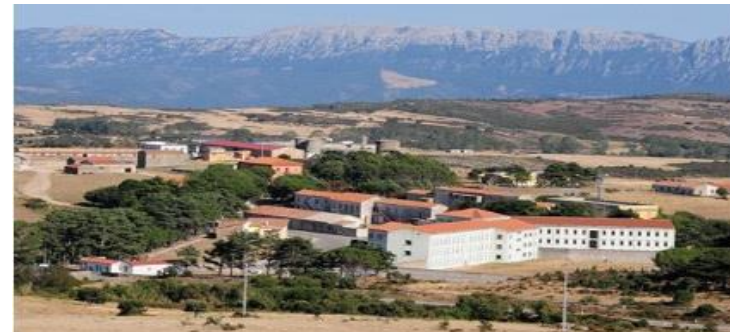
Presenza di n. 2 istituti di pena nel territorio dell'ASL di Nuoro (Badu e Carros e Mamone)